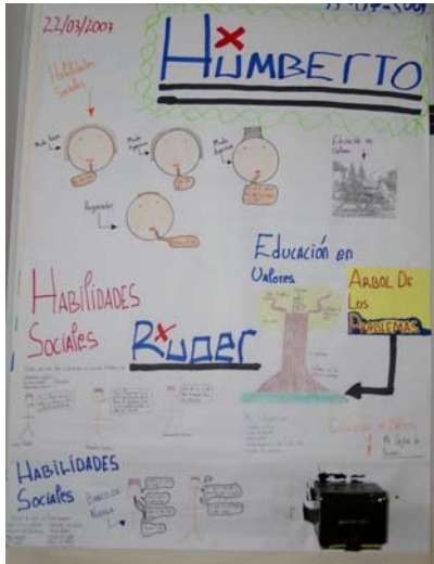
Alumno I.E.S. Pastoriza, 3º de E.S.O.