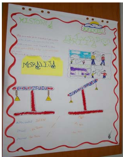
Alumno I.E.S. Pastoriza, 1º E.S.O.