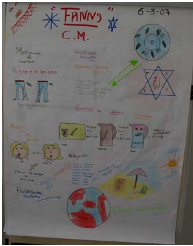
Alumno I.E.S. Manuel Murguía, 2º E.S.O.