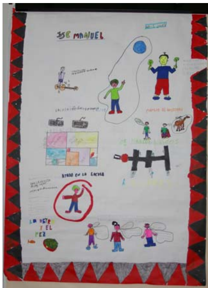
Alumno IES Manuel Murguía, 2º E.S.O.