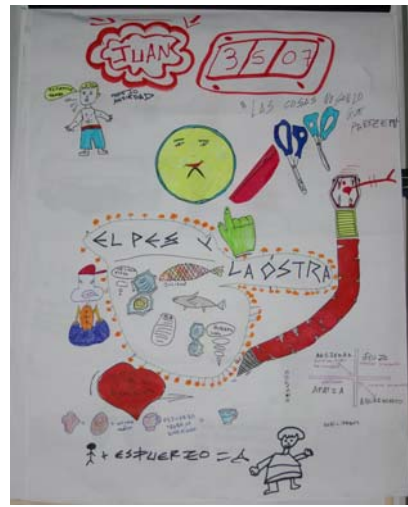
Alumno I.E.S. Pastoriza, 1º E.S.O.